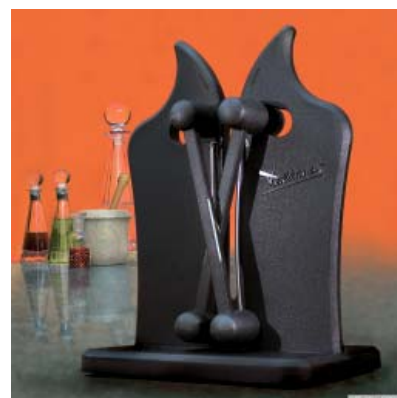
Vulkanus Klassik für den superscharfen Schliff zu Hause

Vertrieb: Vetrag AG, 8712 Stäfa, Tel. (0 44) 928 25 00