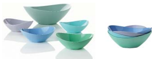
Japanisch-skandinavische Setting Schalen für kalte und heisse Speisen

Der japanische Designer Hiromichi Konno hat ein funktionelles Objekt geschaffen, das mit der wunderschönen Linie skulptural wirkt und so zum geschmackvollen Blickfang auf jedem Sideboard wird. Vor allem die Ausführung in Edelstahl lässt jedes Designerherz höher schlagen. Aber auch die in sanften Pastellfarben aus Melamin gefertigten Setting-Schalen sind zum Verlieben: eine grosse Schale für Suppen oder Salate, die in den passenden vier kleinen Schalen serviert werden. Stapelt man die vier kleinen Schalen, so erinnert der Stapel an eine Blume in voller Blüte.