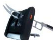
Vulkanus Pocket Classic zum Schleifen unterwegs