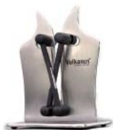
Vulkanus Professional schärft auch Messer mit Wellenschliff