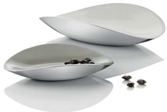
Charisma Schalen aus Edelstahl: charismatisch schön

Vertrieb: Vetrag AG, 8712 Stäfa, Tel. (0 44) 928 25 00