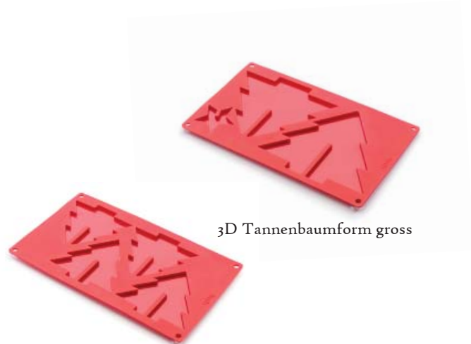
3D Tannenbaumform klein