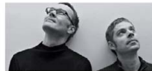
Jehs & Laub