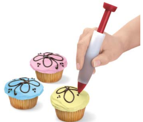
Mit leichtem Druck auf beide Seiten schreiben und verzieren.