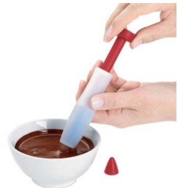
Stift mit der Deko-Flüssigkeit aufziehen.

Vertrieb: Vetrag AG, 8712 Stäfa, Tel. (0 44) 9 28 25 00